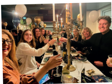
Jaarafsluiting TCK diner