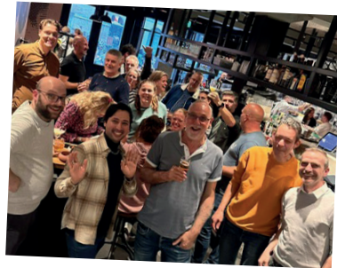
Een geslaagde TCK borrel in Utrecht