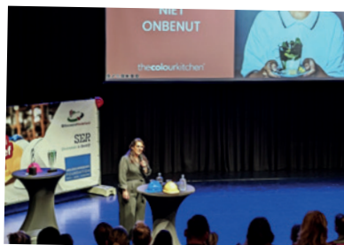
Aanwezig bij de uitreiking van de Bouw en Infra Inclusief Award