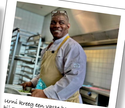
Urni kreeg een vaste baan bij FC Utrecht