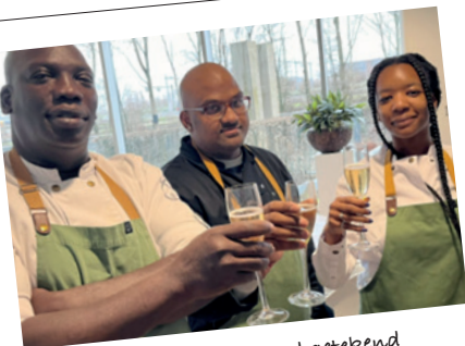
Het sociale convenant werd getekend tussen Deloitte en The Colour Kitchen