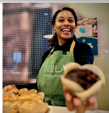
In de week van Gelijke Kansen gaven we terug aan partners en deelnemers