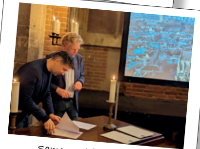
Samenwerkingsovereenkomst met gemeente Utrecht