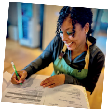
Een certificaat voor Requelle!