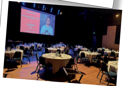
Impact diner Zuilen