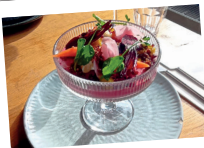
Dutch Cuisine restaurant Zuilen