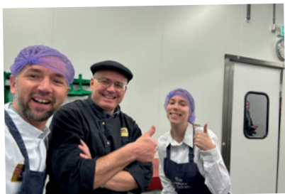
Wachten op de koningin!