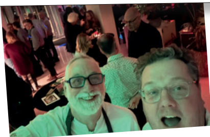
Feest bij PKN