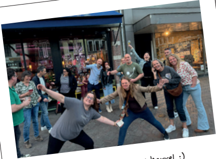
Een gezellige TCK borrel :)