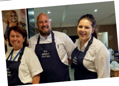
Nieuw contract bij Woonin